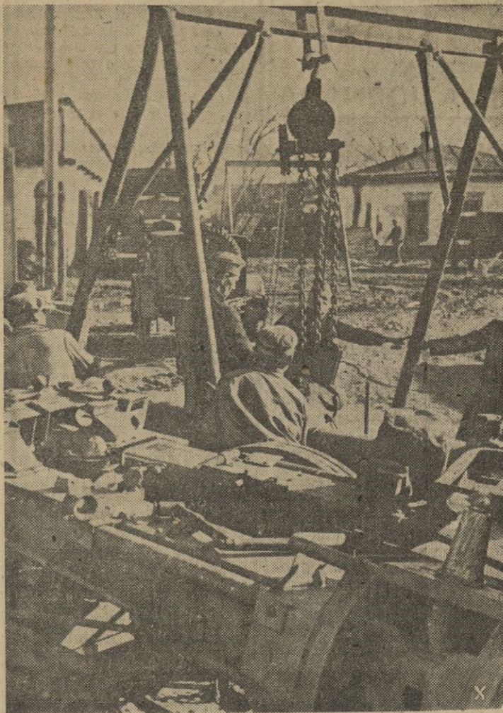
Es necesario reparar completamente este cañón. Todos los hombres ayudan para desmontar las partes averiadas.