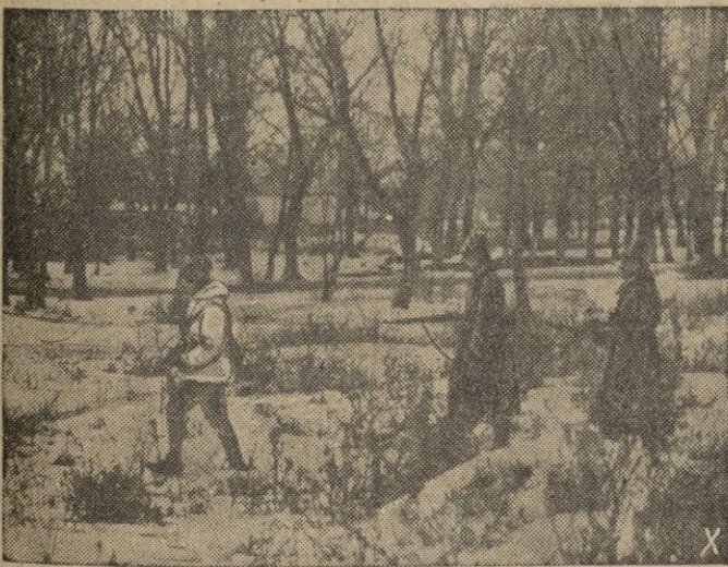
Una patrulla de las fuerzas anticomunistas vigilando en un claro del bosque.