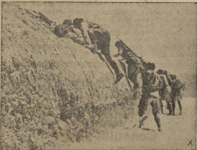
Las fuerzas italianas se lanzan al ataque en el frente tunecino.