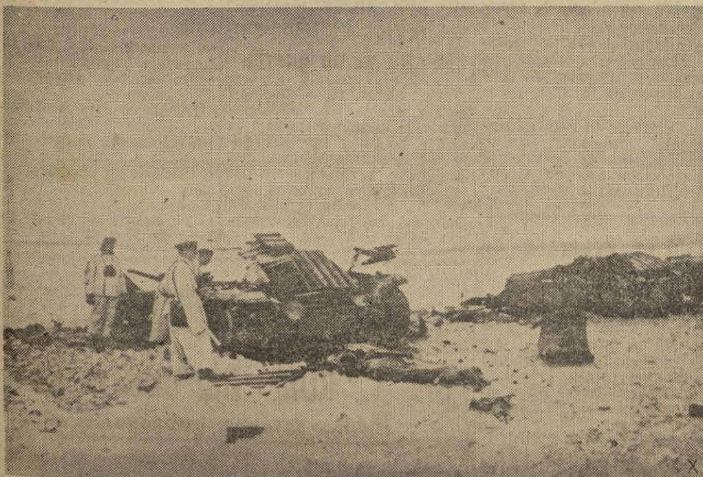
Dos tanques ingleses que marcharon contra una posición alemana fueron destruidos en 10 minutos