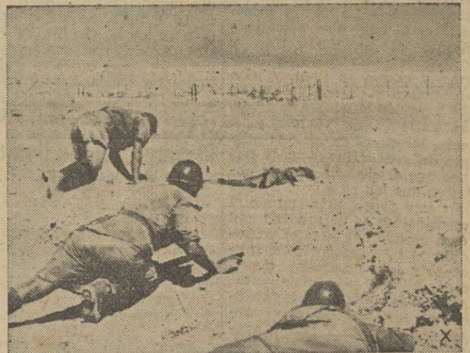
Las fuerzas italianas se disponen a atacar una posición enemiga.