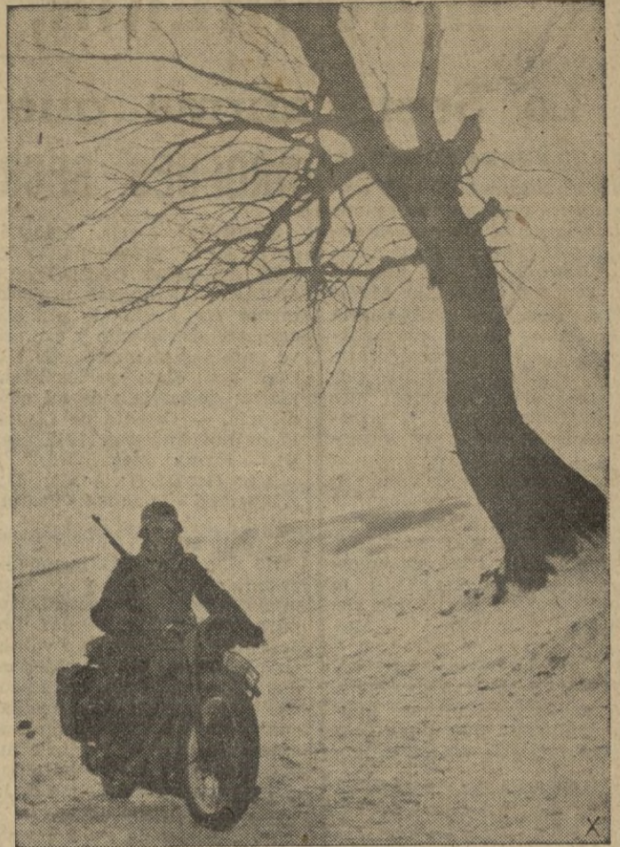
En enlace alemán lleva el parte encomendado a la formación de vanguardia.

—termina diciendo hay que combatirlo allí donde aparezca, aunque sea en pequeños intentos revolucionarios. — EFE.