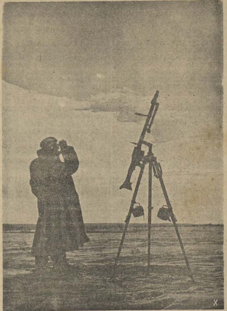
Alerta contra los aviones enemigos.