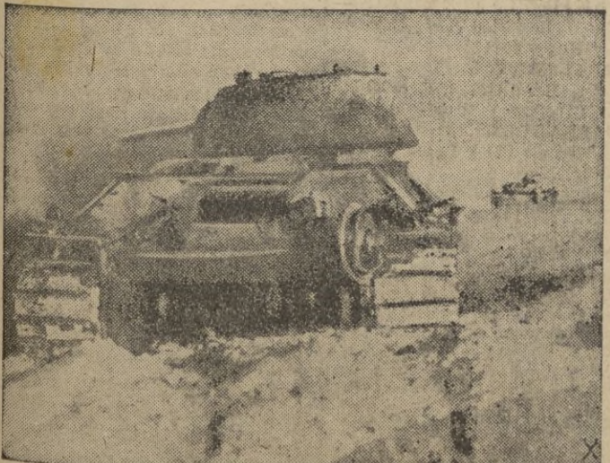
Uno tras otro, los tanques soviéticos quedan inutilizados delante de las posiciones alemanas.