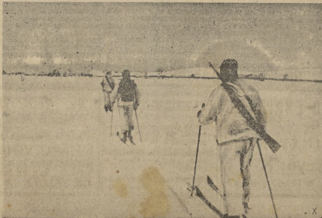
Colocación de un cable con esquí