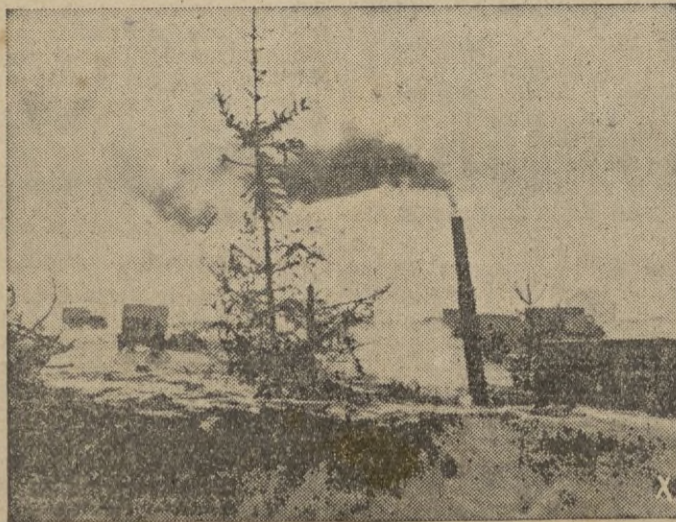
Aspecto de un sistema fortificado alemán en el sector del lago I'men.