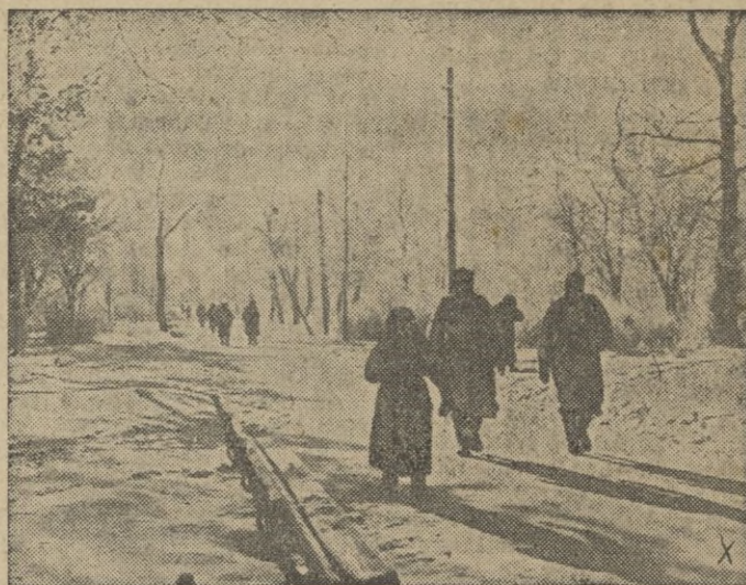
Gracias a los esfuerzos alemanes, la retaguardia rusa dispone hoy de buenas carreteras.

Madrid, 17. — Su Excelencia el Jefe del Estado y Generalísimo, agradece el telegrama de adhesión que en nombre de esa Universidad y Academia se le remitió y envía a todos sus saludos. — CIFRA.