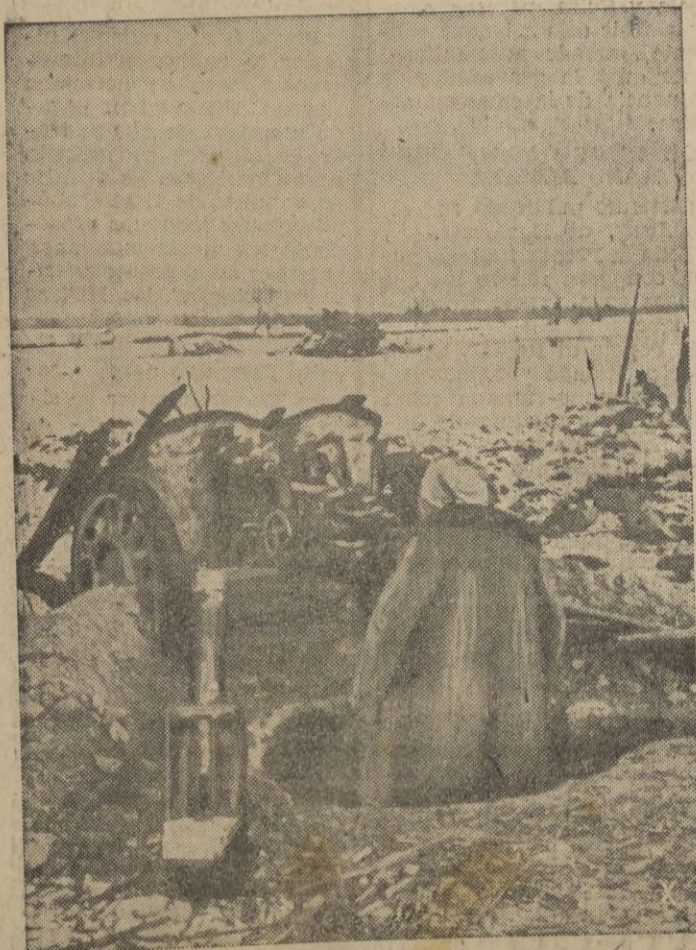
Los tiradores a emanés ejercen una extremada vigilancia ante la aparición de tanques en la superficie helada.