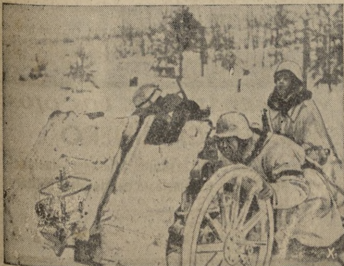
Un cañón antitanque combate a los monstruos soviéticos que intentan atacar una posición "erizo" alemana.