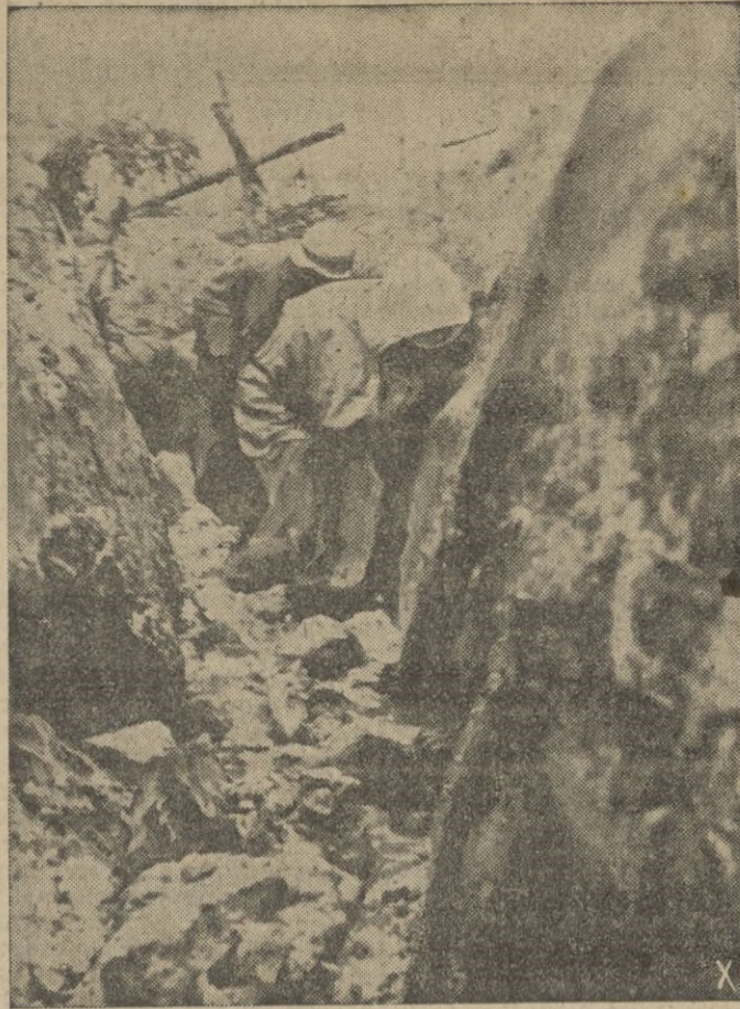
Bajo el intenso fuego del enemigo, los granaderos se dirigen a un extremo de la trinchera para relevar a los compañeros.