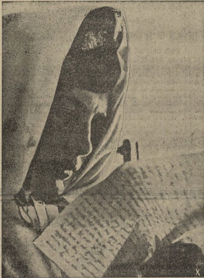
El contraataque contra los bocheviques va a comenzar dentro de pocos minutos. Este soldado alemán aprovecha los momentos de esp. ra para leer, una vez más, la última carta de su mujer.