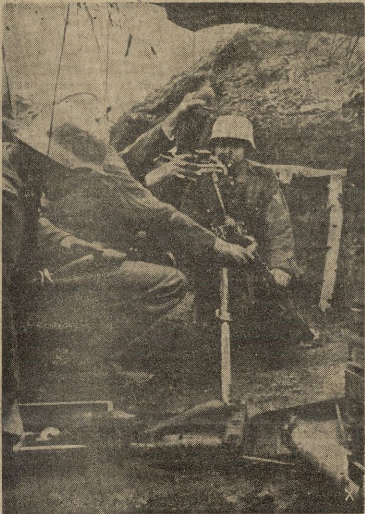
Contra la ciudad sitiada son lanzadas continuamente granadas. La foto muestra un instante de la lucha.