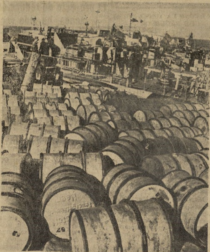
En un puesto de la Crimea, ligeras fuerzas de la Marina se preparan para una nueva empresa. Las pequeñas unidades reciben combustibles.