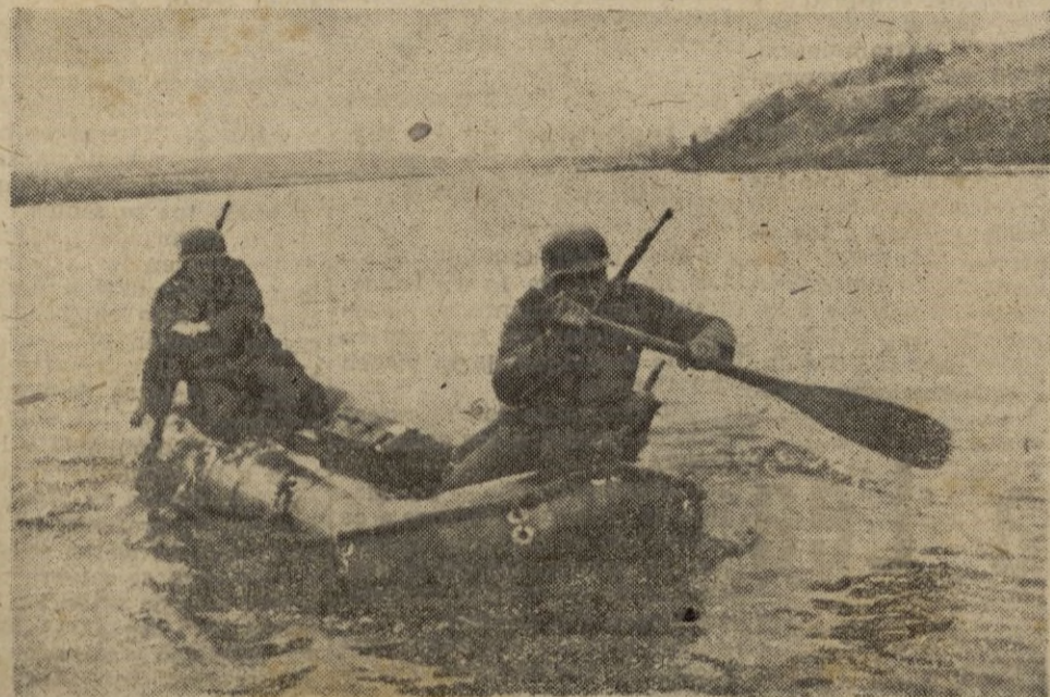
Los soldados alemanes que defienden la cabeza de puente conquistada en el Kuban permanecen alerta contra todos los movimientos del enemigo. Estos dos infantes germanos se dirigen a la orilla opuesta del río, ocupada en este sector por los soviets y llevan a bordo del bote neumático una carga explosiva para destruir un fortín soviético de la línea avanzada.