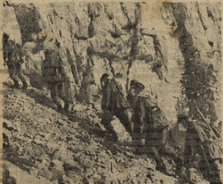
Soldados alemanes ascienden por una montaña caucásica para llevar a cabo un reconocimiento. La marcha es lenta y hay que estar atentos contra cualquier repentino movimiento del enemigo, solapado y oculto entre los angostos picachos.