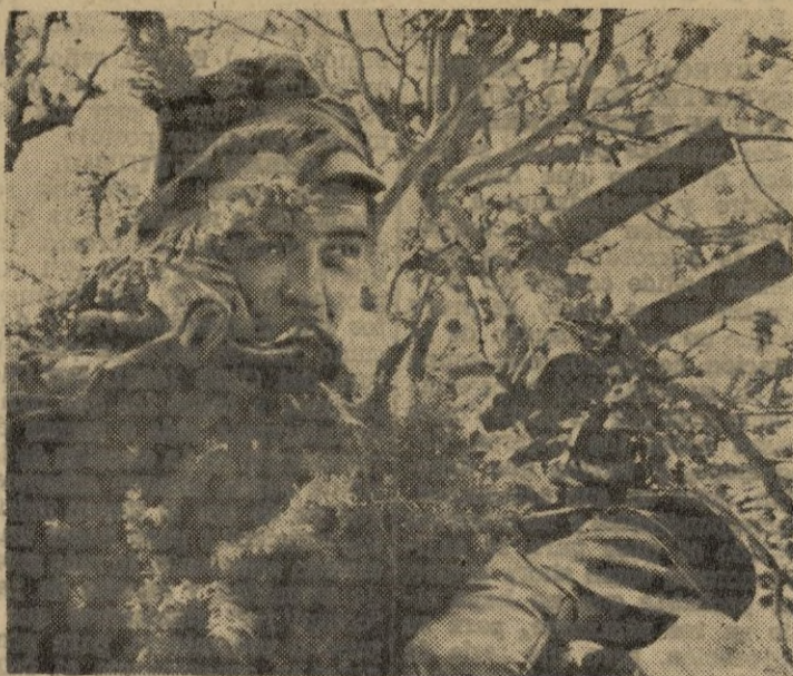
Desde el observatorio en pleno bosque, este soldado comunica con el puesto de mando.