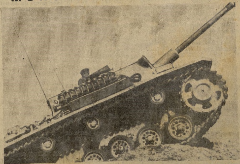
En la gran batalla que se desarrolla entre Bielgorod y el Sur de Kursk, los tanques desempeñan un gran cometido. He aquí la estampa guerrera del monstruo de acero, que parece acecha la presa para lanzarse violentamente sobre ella.