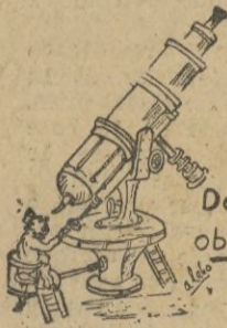
Desde mi observatorio