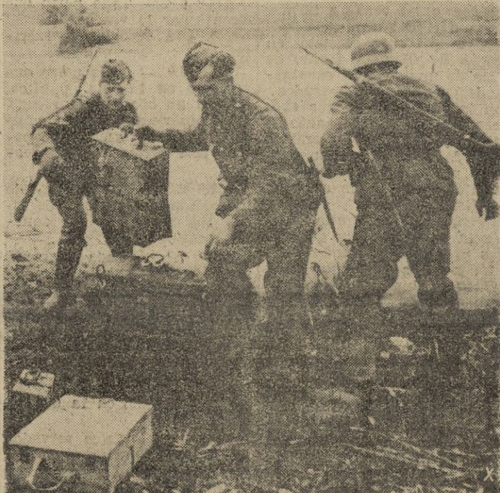
Soldados alemanes, desembarcan en una cabeza de puente, con material de comunicaciones.