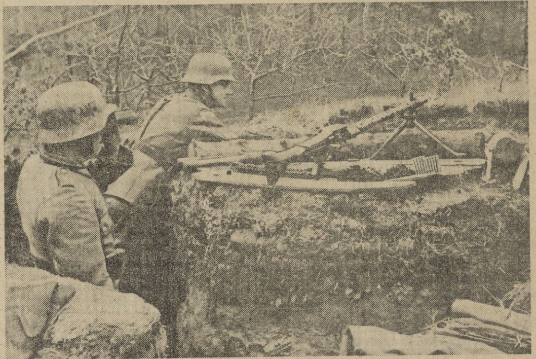
Un punto de apoyo, en las primeras líneas alemanas del sector de Biélgored