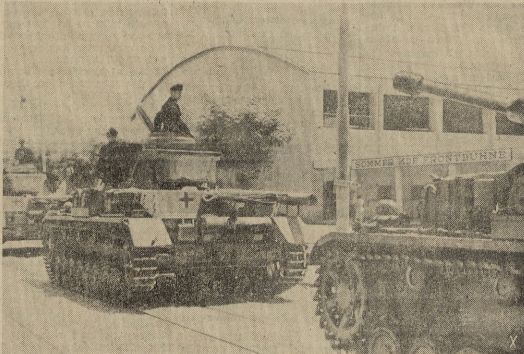
Una columna de tanques alemanes marcha hacia el terreno de operaciones