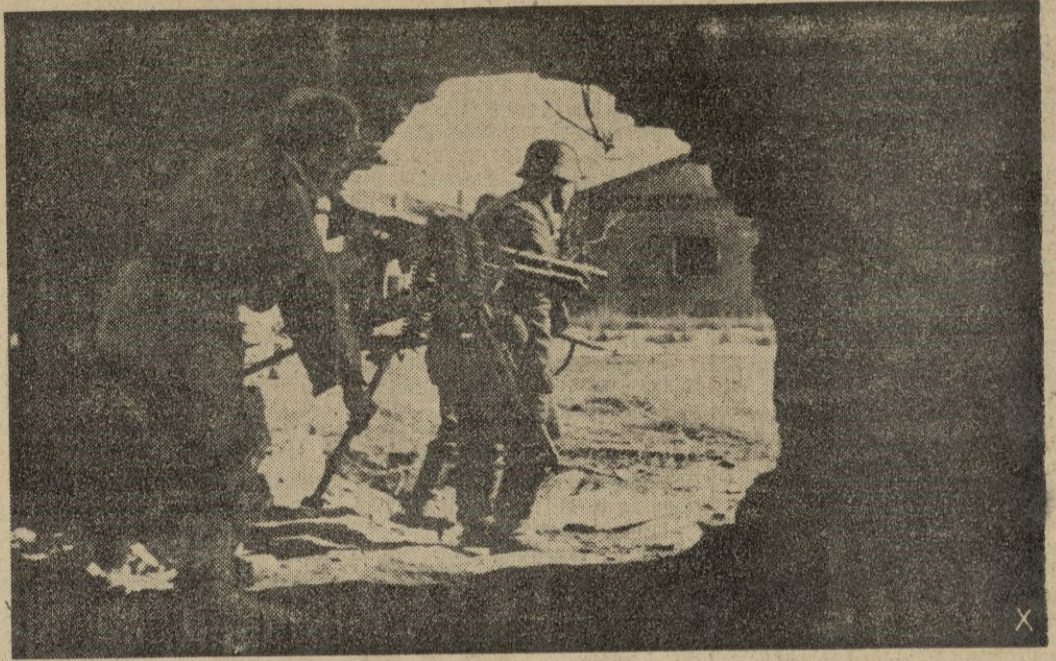
Soldados alemanes de Infantería emplean una ametralladora entre las ruinas de una población del Orel. Rapidamente comenzará a funcionar la máquina contra unas casas del pueblo donde los soviets ofrecen momentánea resistencia.