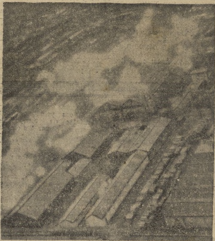
Interesante fotografía aérea del bombardeo a una estación ferroviaria italiana.