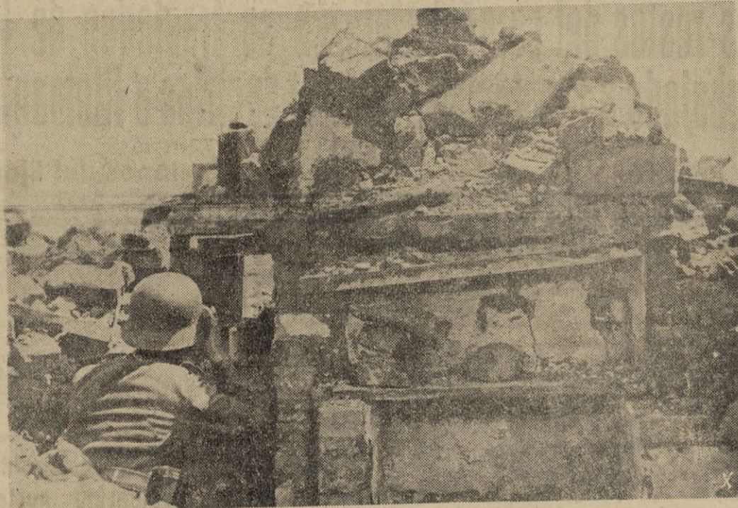
Este tanque empotrado en la trinchera y camuflado con piedras, sirve de excelente puesto de observación para una avanzadilla alemana.