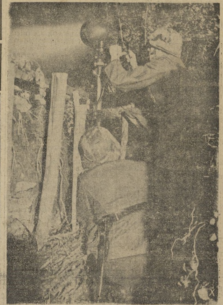
En determinados lugares del frente ruso, son instalados potentes reflectores móviles, para iluminar el campo de batalla, cuando lo requieren las circunstancias.