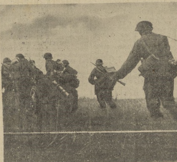
En la zona de Bielgorod y el Sur de Orel, las tropas alemanas penetran profundamente en las posiciones soviéticas.

inflingieron pérdidas muy elevadas a las fuerzas canadienses y norteamericanas especialmente a los grupos que intentaban avanzar contra las alturas del valle de Dittiano.