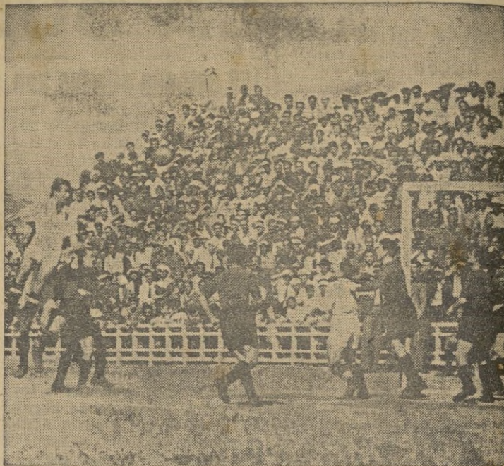
Morla, de un magnífico salto, consigue rematar de cabeza y cruza imparablemente el primer gol ceutí al minuto y medio de juego.

A los 35 minutos, se produce un barullo ante la meta local. Rubio sale otra vez, pe-