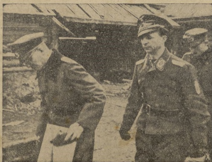
El general Jordán visita un sector del frente ruso defendido por una formación de paracaidistas