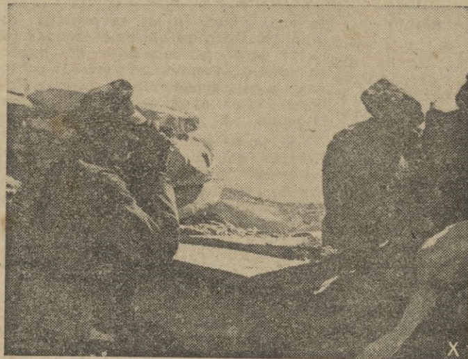
El oficial de una batería alemana comprueba desde un alto la eficacia del tiro.

de tres mil vuelos y doscientas misiones.