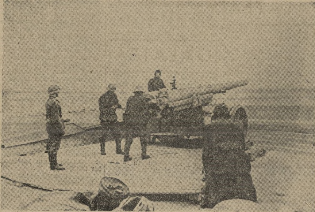
Una posición de la artillería alemana en la costa de la Mancha