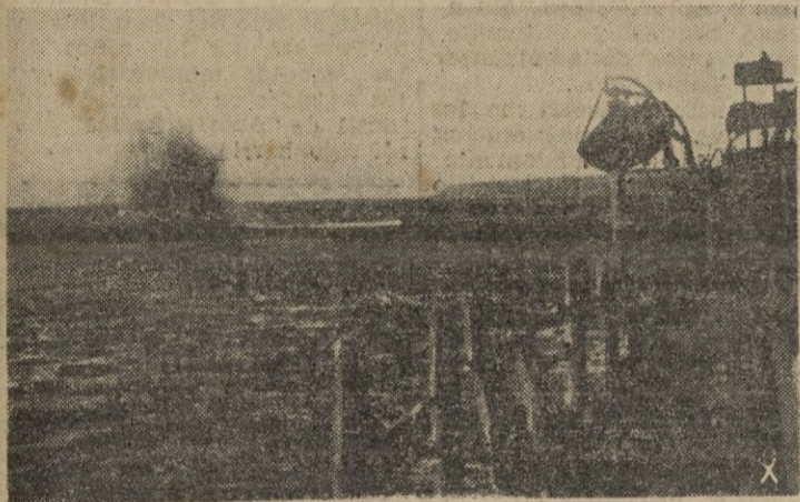
Buques de escolta protegen el acarreo de municiones. Las bombas adversarias dibujan el buque, mientras este prosigue su la bor.