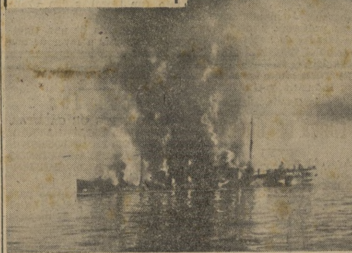
Un buque aliado ha sido alcanzado de lleno por una bomba alemana.