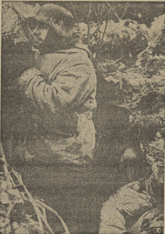
Mientras que el jefe responsable de puesto monta la guardia en intensa vigia, el compañero descansa en la misma posición de primera línea.