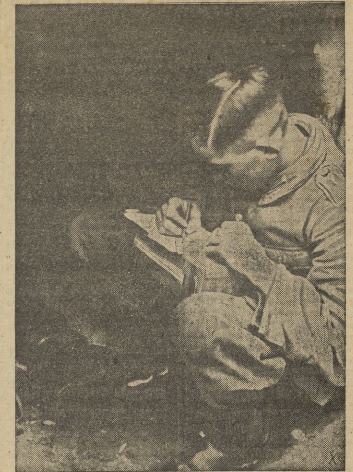
En una hora tranquila, entre dos combates, el soldado escribe a los suyos.

Para la cartera de Asuntos Exteriores se dan los nombres de Chripenberg, ex-embajador en Londres, actualmente ministro en la Santa Sede, así