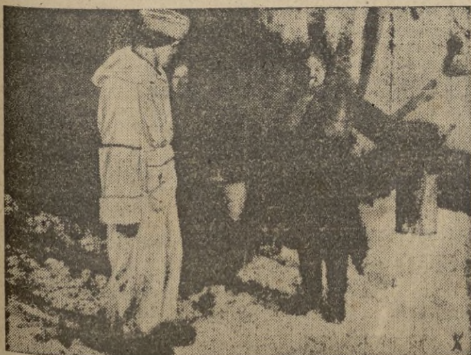
Mujeres rusas colaborando con los soldados en la retaguardia