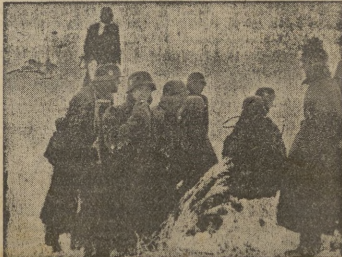
Fuerzas de caballería alemana se preparan para intervenir en la lucha defensiva del sector de T-ropas