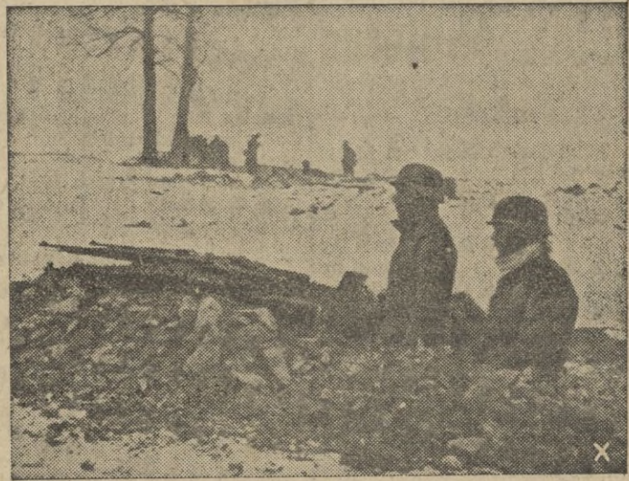
Los soviets lograron perforar la posición anti-comunista, cuyas fuerzas se retiraron en perfecto orden improvisando otras posiciones defensivas.

EL TENIENTE GENERAL MOSCARDO ES NOMBRADO CAPITAN GENERAL DE LA CUARTA REGION