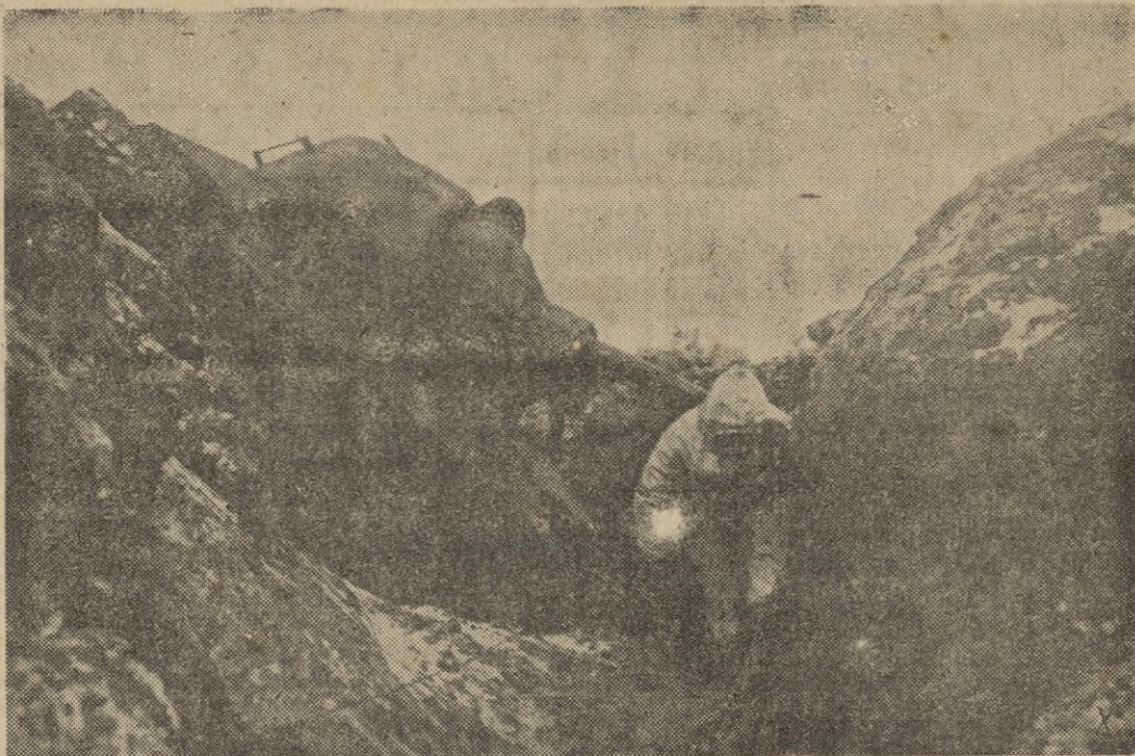
Impávidamente un soldado alemán ha destruido con una mina este tanque ruso, que destruido se precipita en una trinchera.