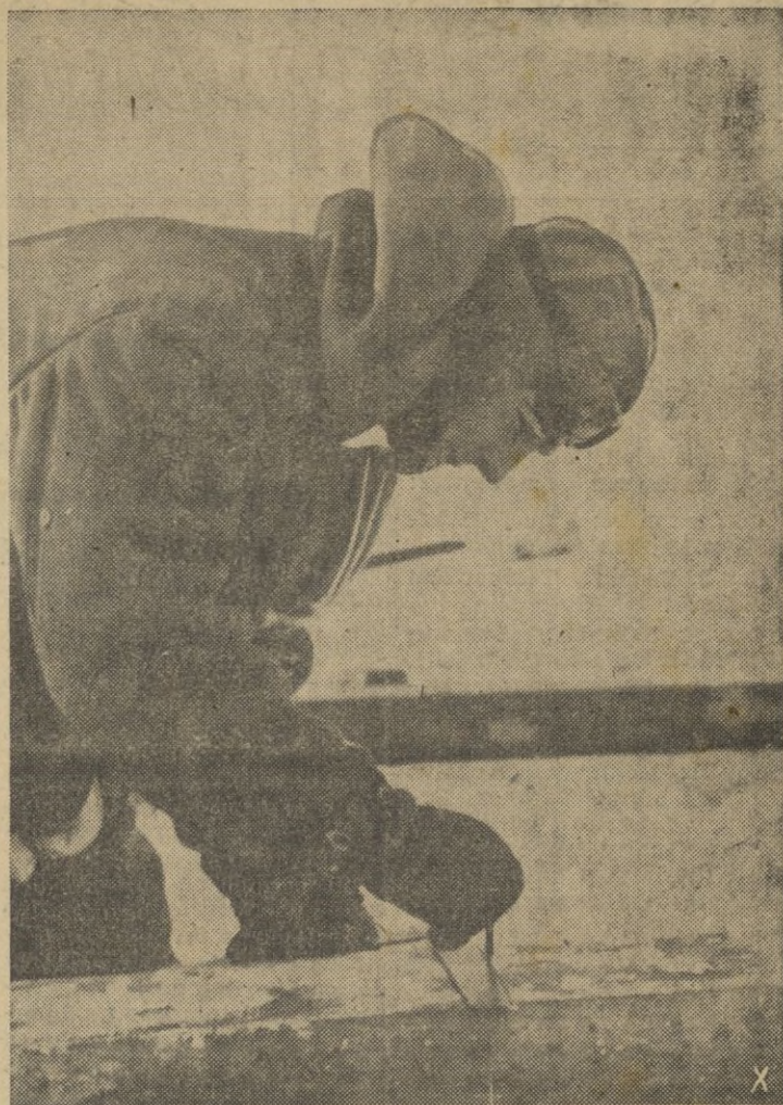
Zapadores alemanes ferroviarios preparan las traviesas para las aberturas de tornillos.