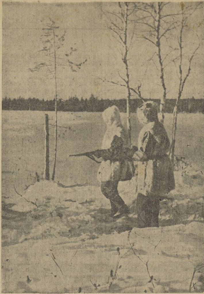
En la inmensa planicie helada del frente del Est., estos soldados prestan su guardia.