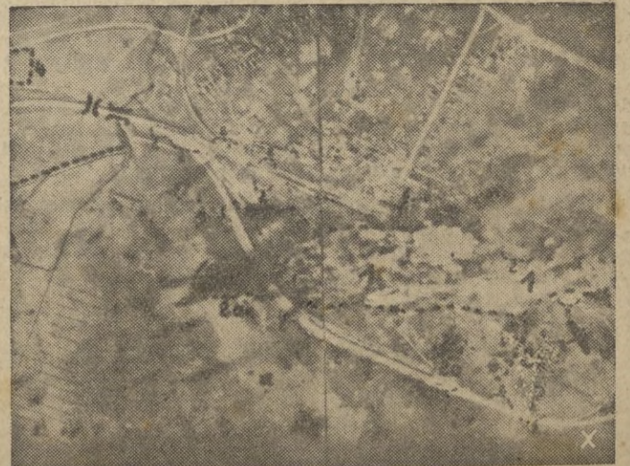
Vista aérea de una estación ferroviaria rusa sometida a un fuerte bombardeo por los "Ju 88"