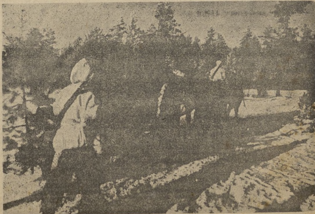
En las primeras horas de la mañana a través del bosque invernal, patines de nieve aseguran la movilidad de la artillería alemana.