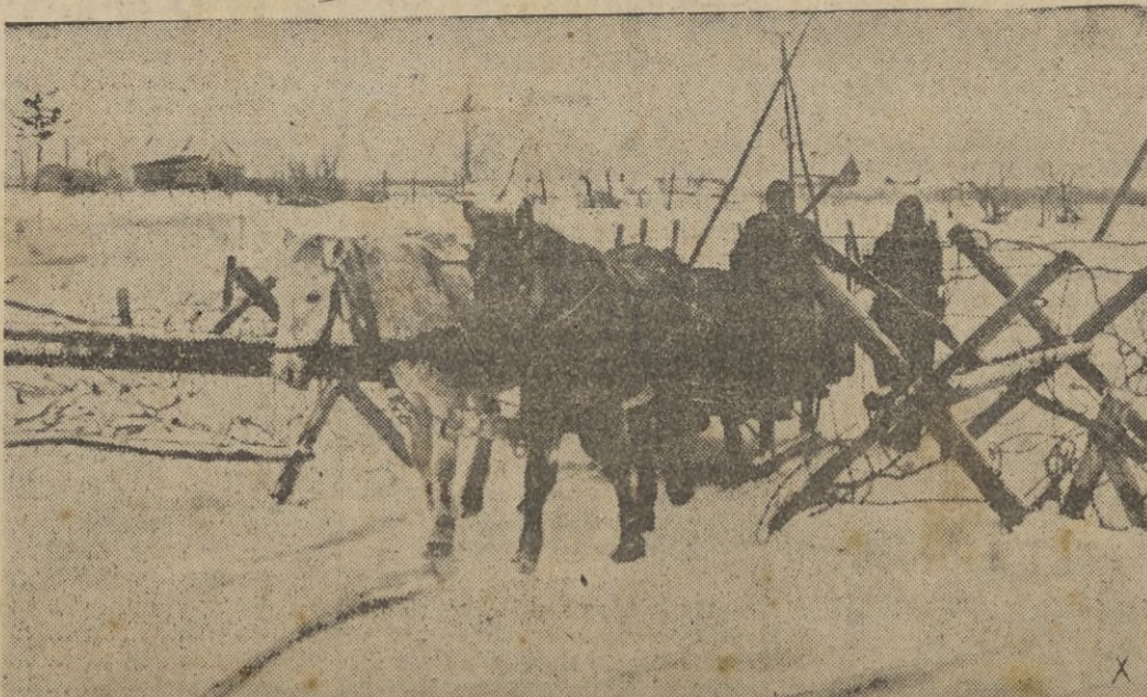
Acarreo hacia una posición avanzada. El primer trineo pasa la alambrada y la empresa peligrosa es felizmente realizada.

Ha sido conmemorado el primer aniversario de la muerte de