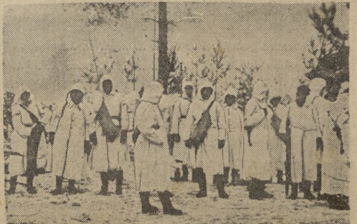
Antes de la caída de la noche, los hombres del grupo de asalto se reúnen para avanzar hacia las primeras posiciones.