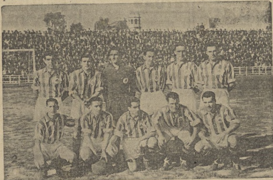
Equipo de la Real Sociedad, que en su campo recibirá esta tarde la visita del Ceuta.

Recibe el Atlético tetuaní al Cádiz. El conjunto andaluz es siempre un rival de mucho cuidado, ante el que todas las precauciones se nos antojan escasas. Máxime cuando aspira a igualarse al Málaga y necesita de un punto fuera de su terreno de juego. Si el conjunto tetuaní actúa como hasta aquí, optamos por un nuevo triunfo suyo. Tiene