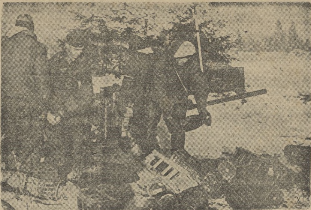
Una batería de obuses alemana, prepara los proyectiles para efectuar un ataque por sorpresa.