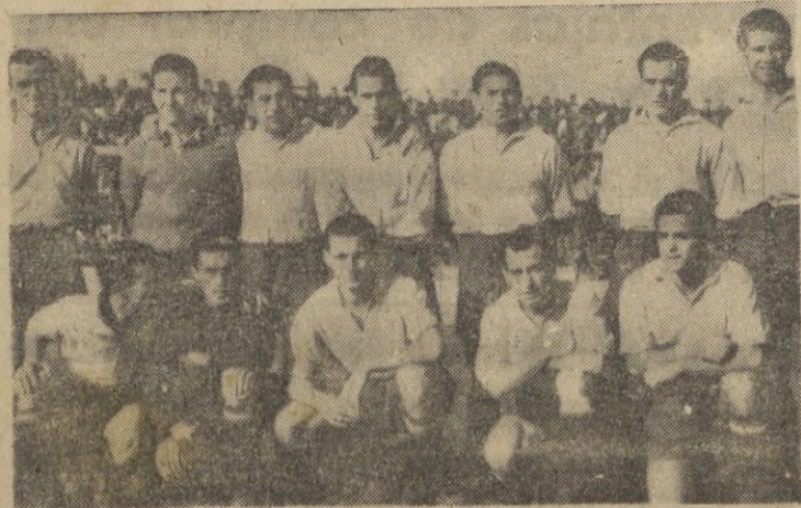
Este es el cuadro gaditano, que en la tarde de hoy disputará al Atlético tetuaní dos valiosos puntos

He sido internacional 21 veces. Jugué contra casi todas las naciones europeas. El equipo que más me gustó de todos los que se enfrentaron