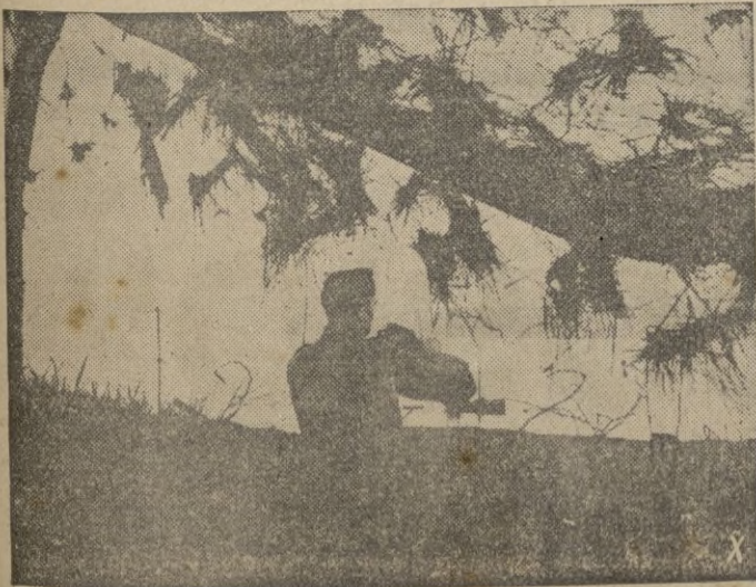
En posiciones bien camufladas los soldados alemanes vigilan en la costa del Mar del Norte.