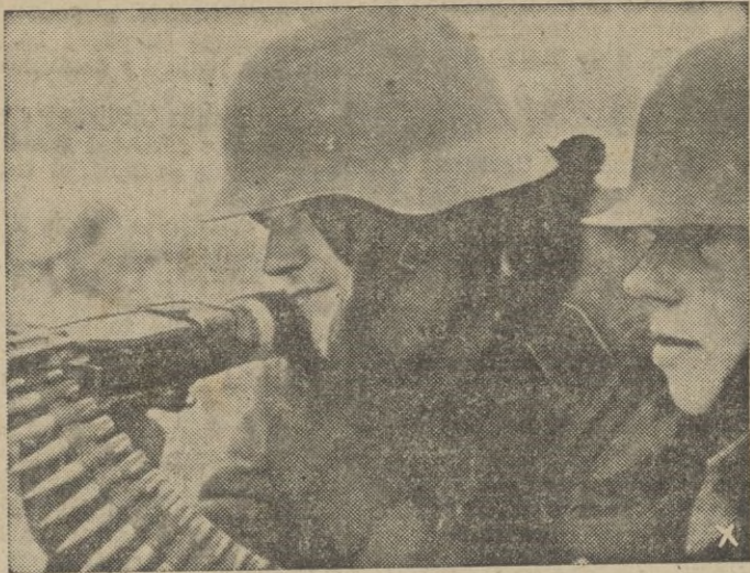
Los soldados europeos cumplen imperturbables el duro cometido de defender a Europa contra el bolchevismo.