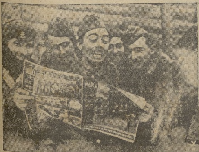
El correo ha traído prensa española.