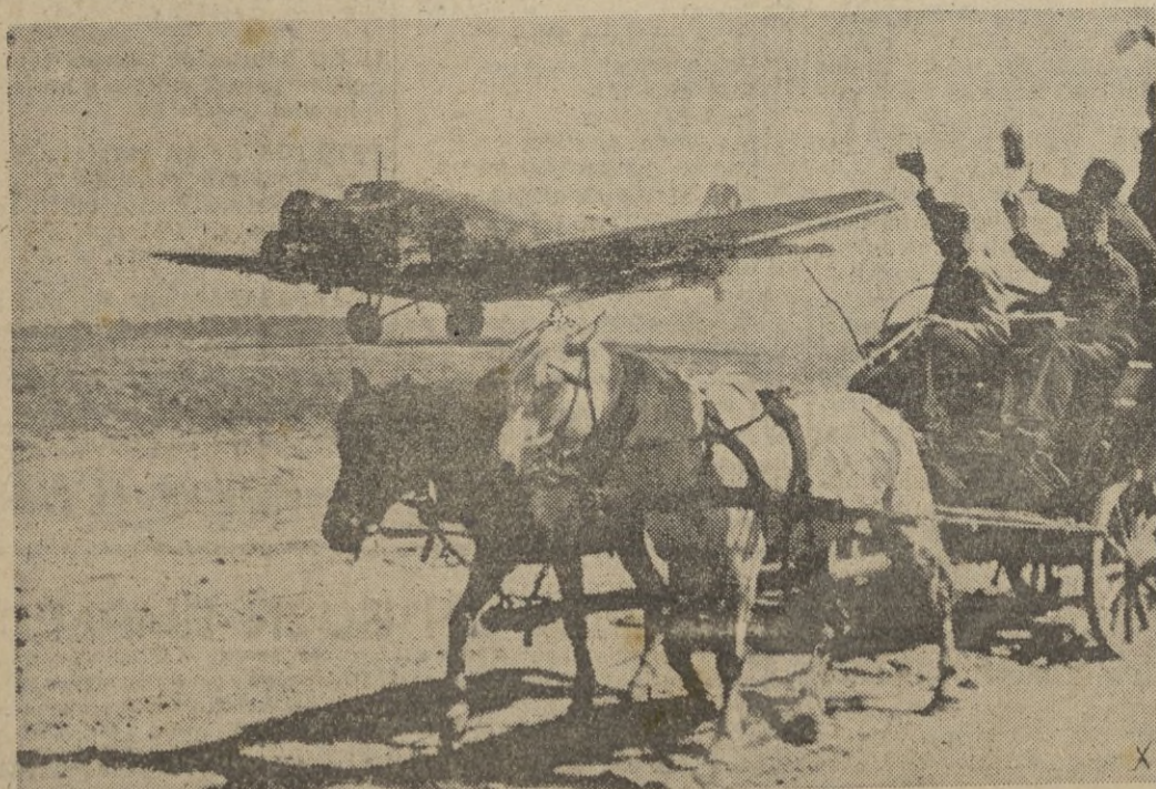
Soldados del arma aérea, y los de Caballería, se cruzan por un instante en el camino rutero de la guerra. El saludo afectuoso, muestra la mejor camaradería.