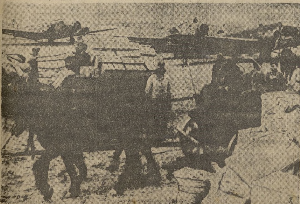
Los pequeños carros de 2 caballos al lado de los grandes aviones Junkers. Unos no son nada sin los otros.