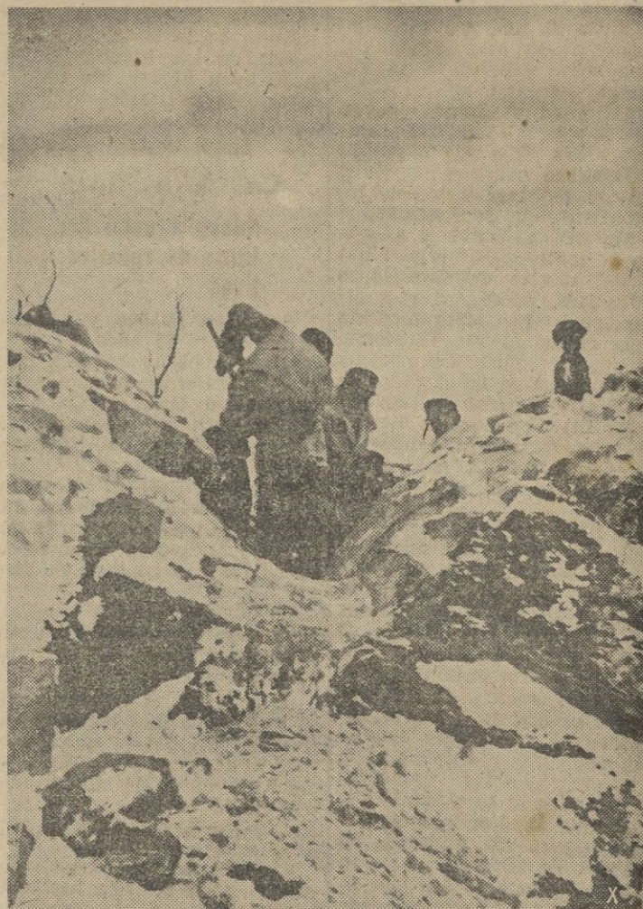
En la soledad del lejano Norte, los soldados comienzan los trabajos de fortificación de un aeropuerto.