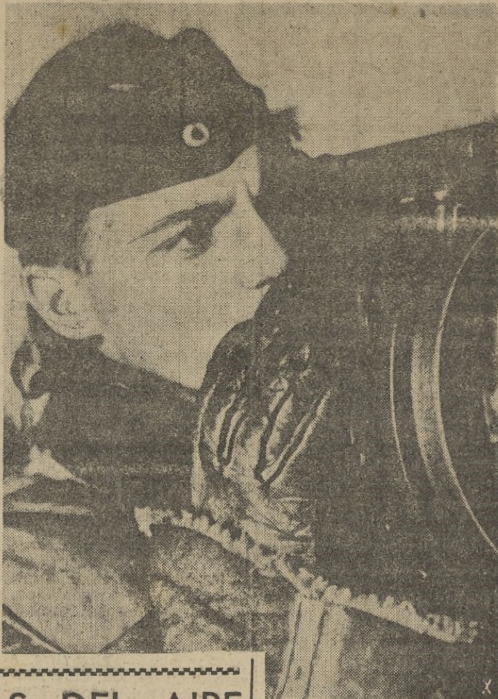
Con la lámpara Morse el señalero trata de penetrar la niebla.