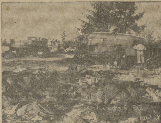
Las fuerzas anticomunistas que contraatacan con vigor en el sector de Jarkov, tropiezan por todas partes con columnas bolcheviquistas destruidas.

teniente general Orgaz, se despidió de S. A., retirándose acompañado de su séquito al Palacio de la Residencia.