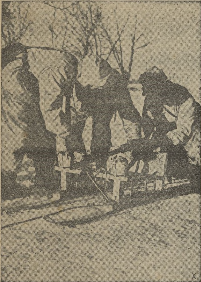
Estos zapadores alemanes construyeron un trineo con los es- quíes montando en aquel la ametralladora ligera.