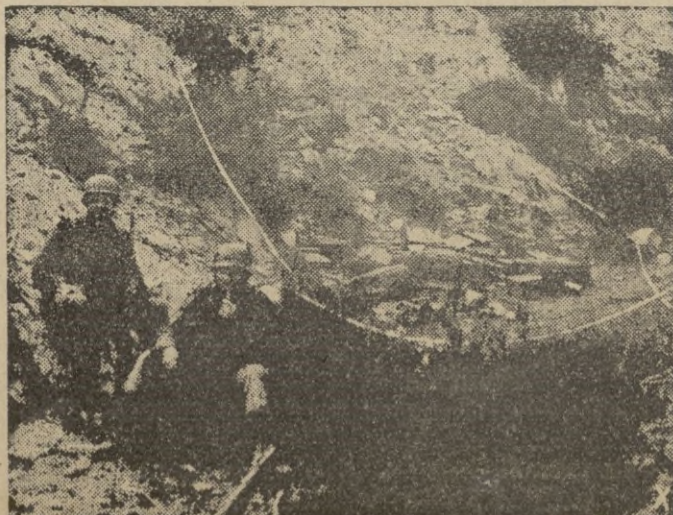
Zapadores alemanes inutilizan los peligrosos artefactos colocados por el enemigo.

sumergibles consiguieron echar a pique más buques, al finalizar el cuarto día de ofensiva. Desde este momento, los hun dimientos se sucedieron ininter- rumpidamente, hasta llegar el convoy a aguas de Gibraltar.