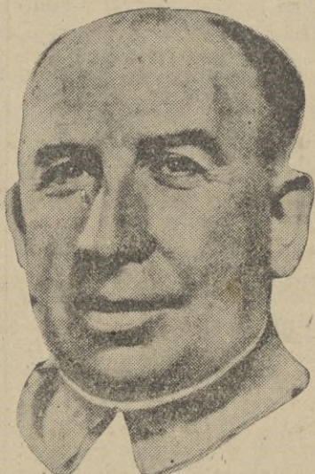
Discurso del Alto Comisario