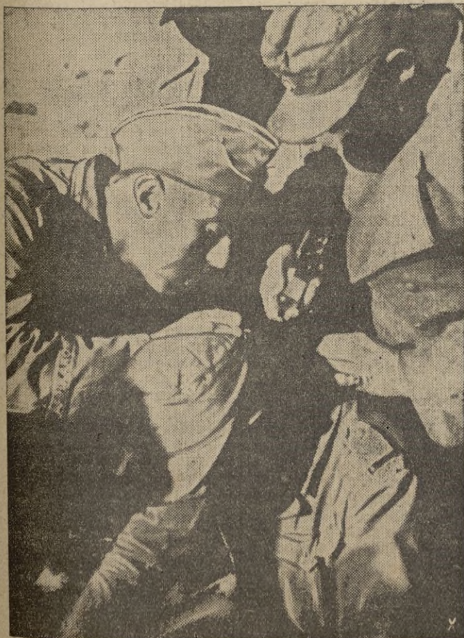
Las pequeñas heridas son atendidas en la misma primera línea.