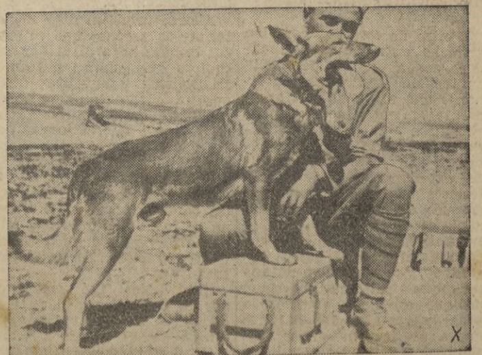
Este inteligente perro ha prestado valiosos servicios a una formación rumana que actúa en el frente ruso.