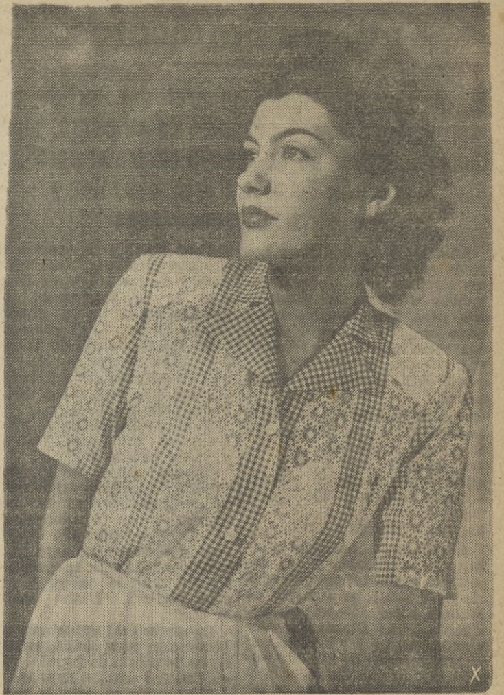
Un precioso vestido de primavera, con originales bordados. El conjunto armoniza perfectamente con la belleza de la modelo.