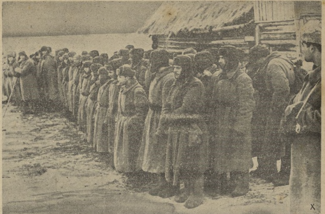
Prisioneros capturados en el frente del lago Ilmen, en un campo de concentración.