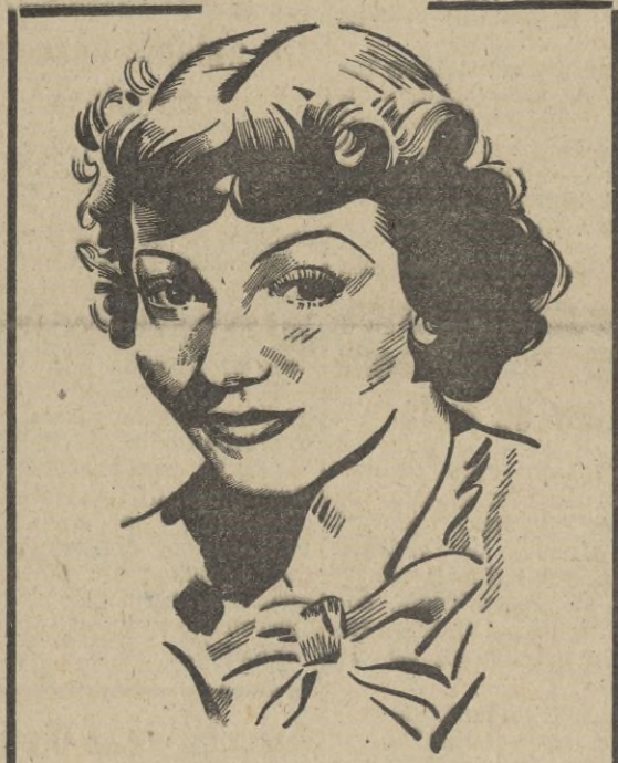
CLAUDETTE COLBERT retirada hace tiempo de nuestras pantallas y que reaparece HOY en CERVANTES con su creación: LA OCTAVA MUJER DE BARBA AZUL junto a GARY COOPER.

cuarta de barro y su rendimiento dejó mucho que desear. Ahora, también por parte del cuadro donostiarra, ha vuelto a repetirse frente al Valladolid, si bien con menos fortuna porque el conjunto castellano — no acostumbrado tampoco a estos terrenos encharcados — tomó sus precauciones y tiró por tierra todas las ilusiones puestas en un procedimiento que, además de no ser nada deportivo, tampoco está lleno de perfecciones. Callamos este detalle tan interesante cuando nos fué relatado por nuestro jugador a su regreso de San Sebastián. A lo mejor había un poco de