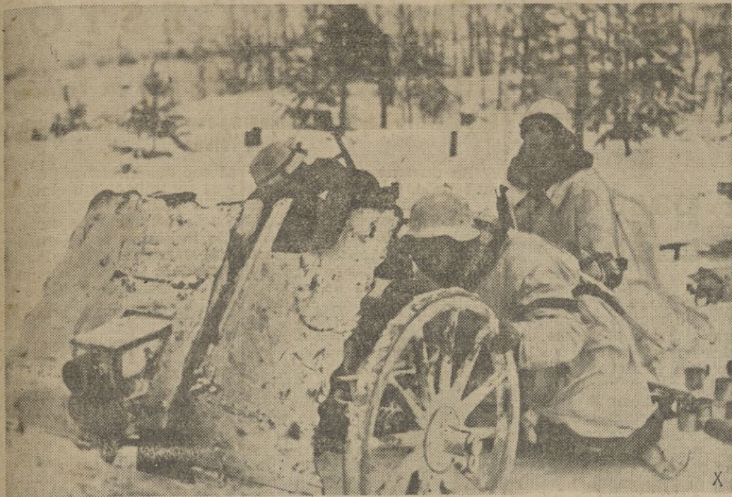
Granada tras granada lanza la artillería alemana contra los tanques soviéticos hasta que el ataque es detenido.