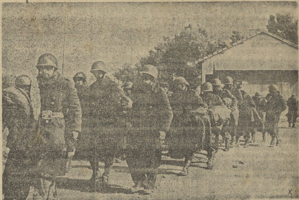
Prisioneros americanos que fueron capturados durante las últimas victoriosas operaciones por tropas italianas en el frente de Túnez.

el concepto de lucha que anima a los falangistas de Teruel para que sigan en el servicio de unidad, grandeza y libertad de España.