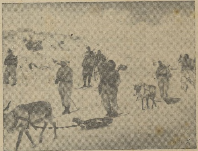
Una patrulla de fuerza blindada alpina alemana, explora el terreno en la tundra del Norte de Finlandia. Renos tiran a los pequeños trineos que transportan municiones y víveres.