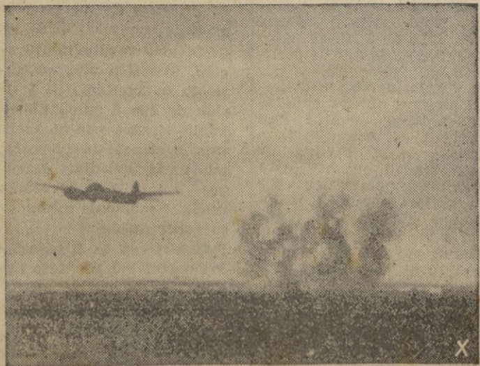
Aparatos en picado del tipo "Ju 88" atacan un importante nudo ferroviario.