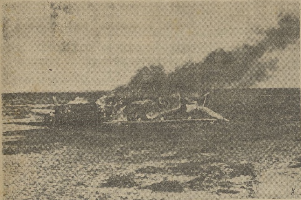
Un avión Spitfire fué derribado por un FW 190. El piloto se salvó del avión en llamas y cayó en manos alemanas.