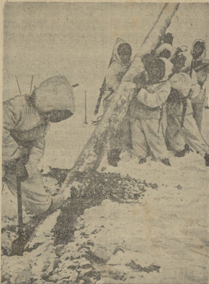
Postes telegráficos son puestos por soldados alemanes del servicio de comunicaciones. No obstante el frío y la nieve, los soldados cumplen su duro servicio.