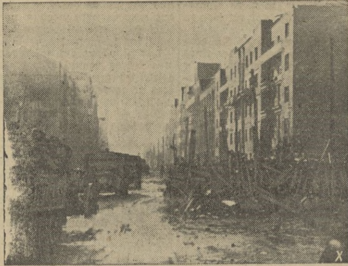
Fuerzas blindadas alemanas atraviesan las calles de una población rusa.