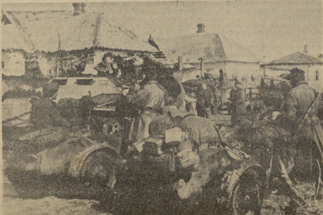
Un destacamento alemán en un lugar de Túnez.