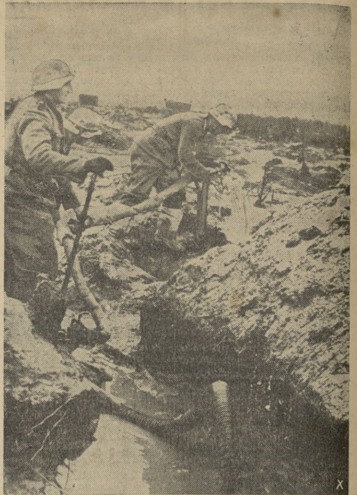
Los soldados alemanes cumplen en los frentes de batalla el trabajo encomendado.