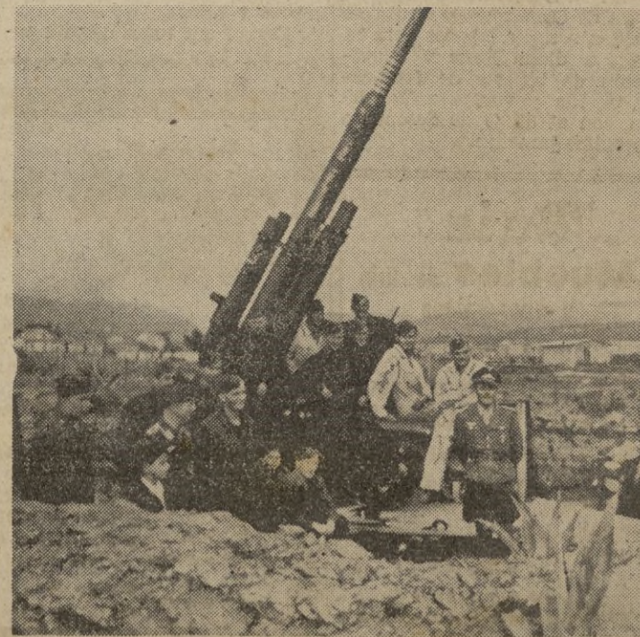
Cañones antiaéreos en un lugar del frente, en un momento de asueto