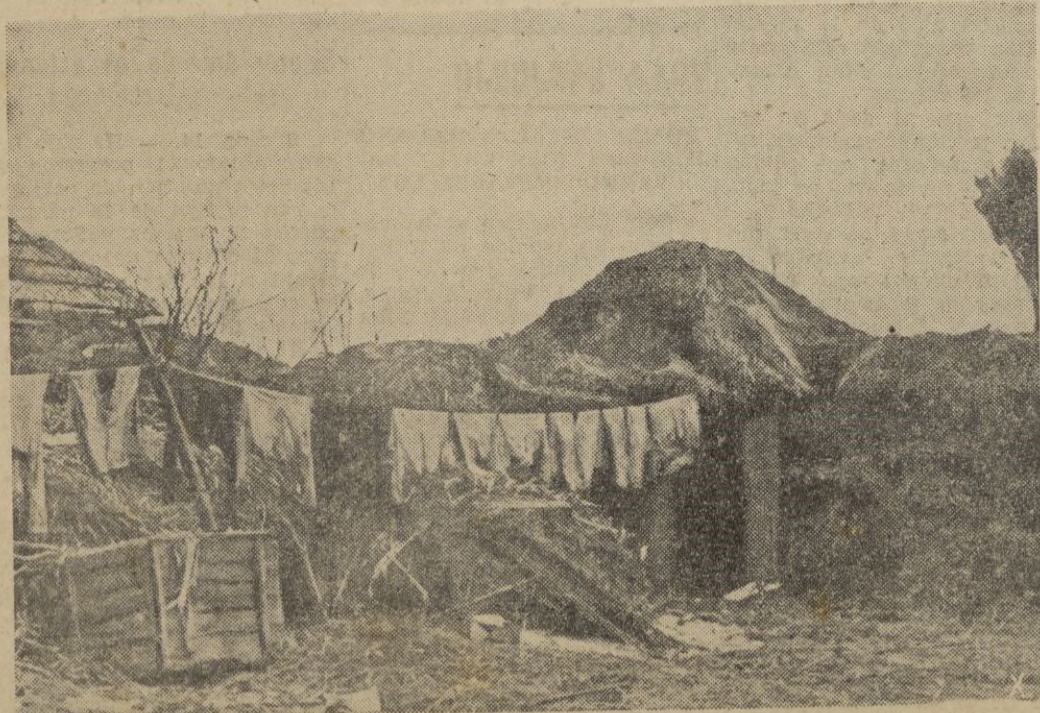
Cuando en los frentes llega un momento de calma se aprovecha para lavar la ropa y secarla al débil sol de Rusia.