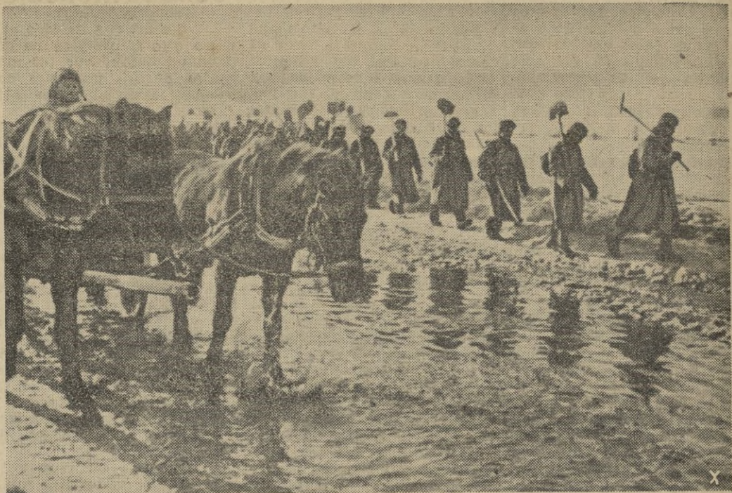
Los caminos y carreteras encharcados a consecuencia del deshielo, son puestos nuevamente en estado de circulación gracias al eficaz servicio de limpieza.

nes diplomáticos turcos desde hace cuatro años y sin herir a ninguno de los dos bandos adversarios ha logrado resolver los problemas más delicados y difíciles del Derecho Internacional. Turquía cree que toda nación debe tener libertad para salvaguar-