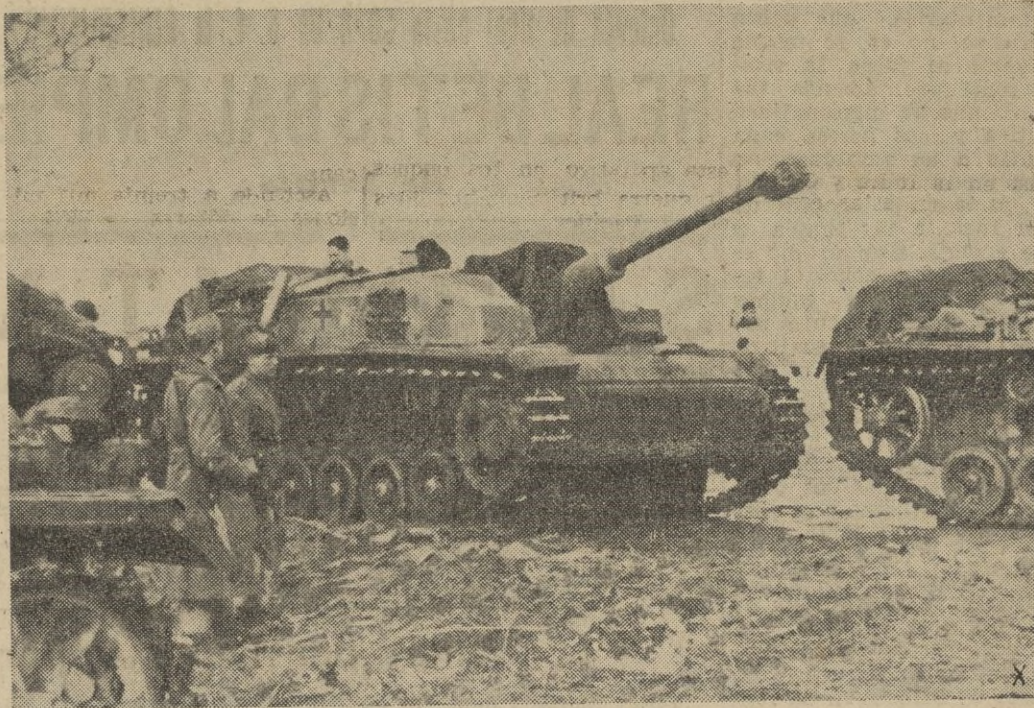
Tanques alemanes camino de una línea de vanguardia.