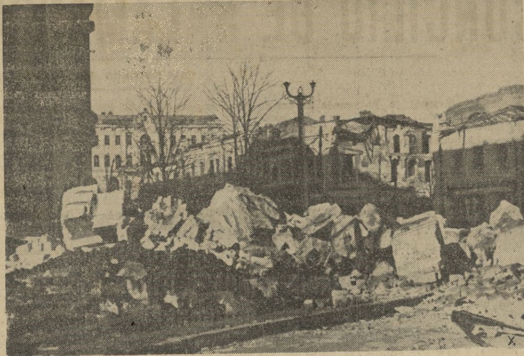
Aspecto que presenta una ciudad de retaguardia después de un bombardeo