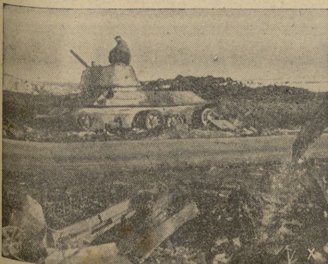
Huellas de los últimos combates librados entre Belgorod y Jarkov.