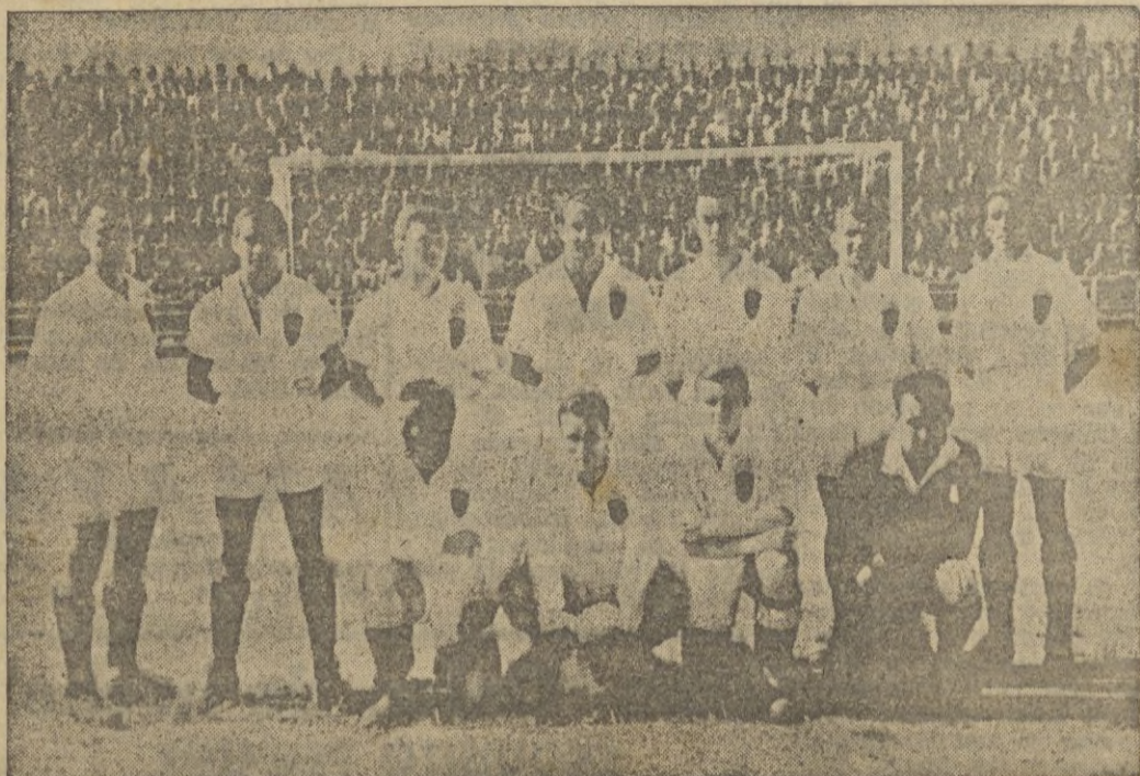
El "Ceuta", que esta tarde recibe en el Alfonso Murube al "Betis" y al que una mínima victoria llevaría hasta los cuartos de final de la Copa del Generalísimo.