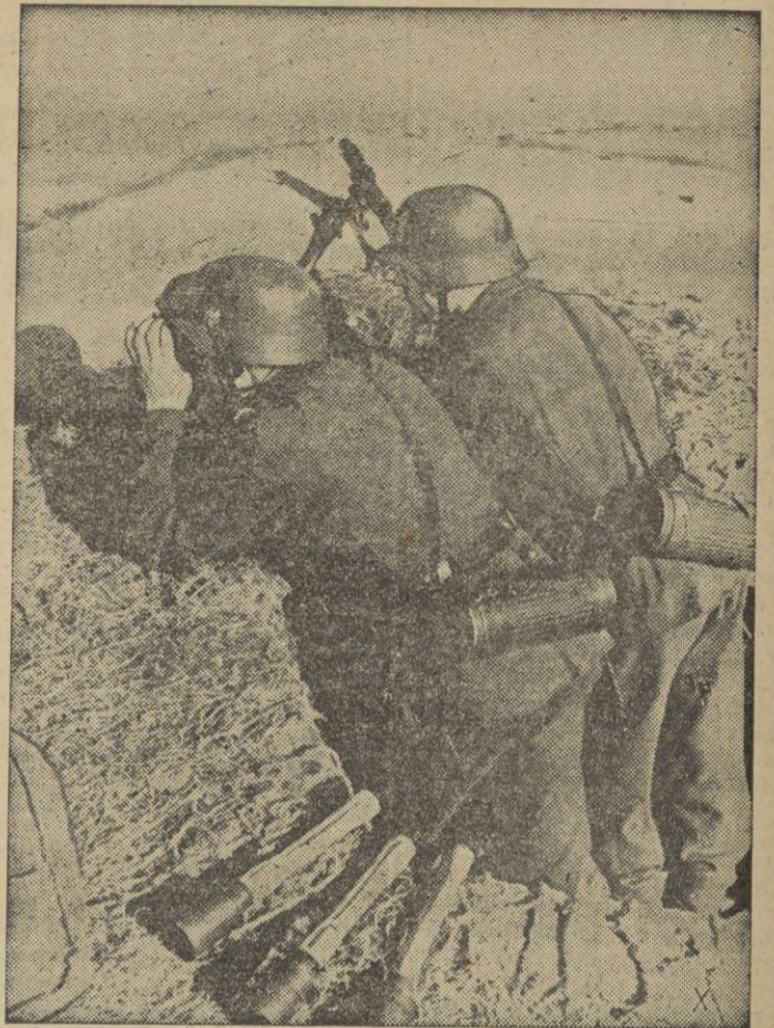
Un puesto de observación avanzado de la costa del Canal de la Mancha.

tres pequeños barcos de pasajeros y uno de transportes. Anteanoche, catorce aparatos "Wellington" efectuaron un fuerte ataque contra Gagliari, donde provocaron formidables explosiones.