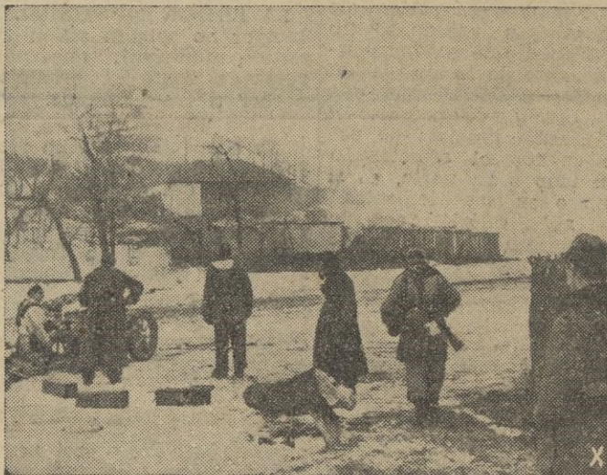
Después de conquistar la estación soviética, la artillería antitanque alemana la defiende de posibles ataques.