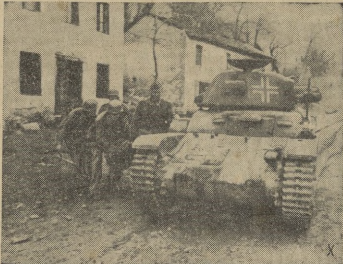
La vanguardia de una formación blindada alemana entra en una población rusa.