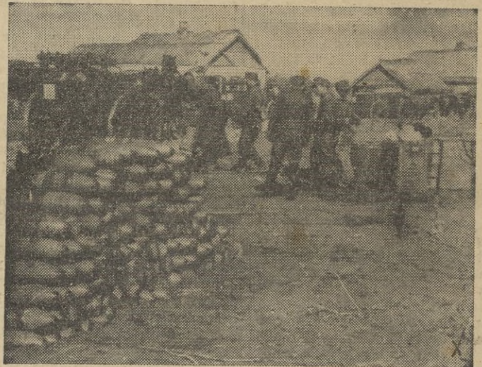
Nuevas municiones llegan al frente ruso