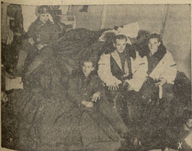
El ataque soviético ha sido rechazado. Los hombres de un destacamento de choque alemán descansan sin desprenderse de su equipo de combate.