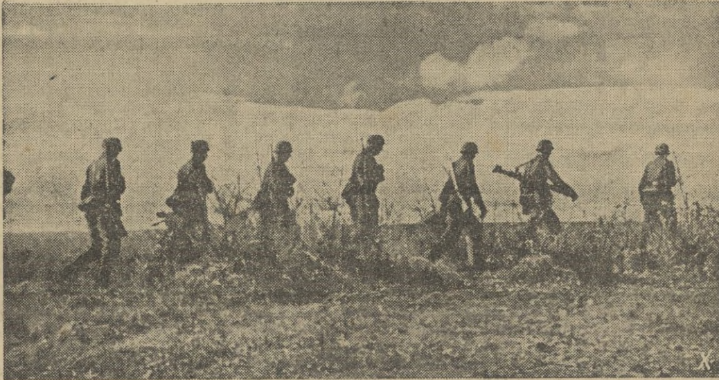
Una patrulla de observación alemana, avanza para tomar nuevas posiciones.