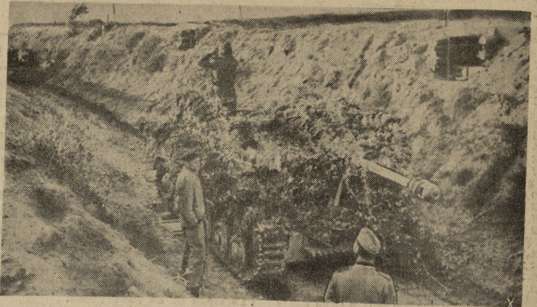
Cañones antitanques alemanes, dispuestos para entrar en acción, en defensa de la infantería que combate a vanguardia