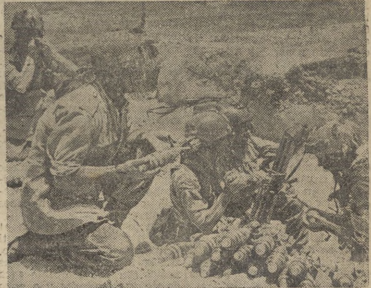
Después de haber tomado posición, estos soldados se disponen a disparar un mortero.