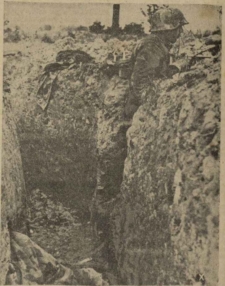
Soldados alemanes, desde sus nuevas posiciones defensivas, se aprestan para el contraataque, después de rechazar las oleadas de tanques