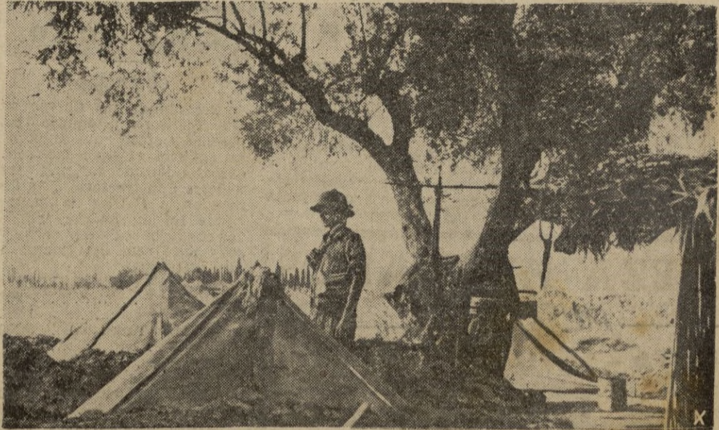
En las costas griegas los soldados alemanes montan su permanente vigilancia, al lado de sus tiendas bajo los olivos.