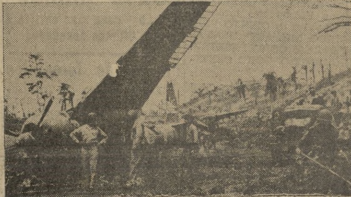
Tropas americanas examinando los restos de un caza destruido en un aeródromo del Pacífico.