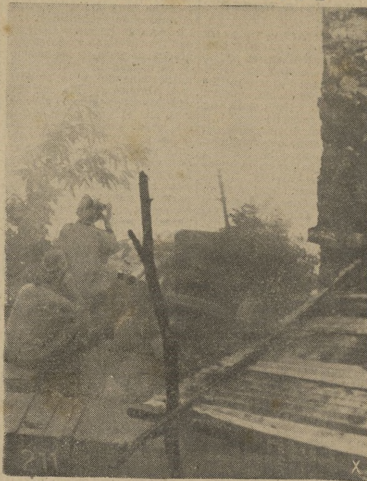
Antitanquistas alemanes a la espera de la aparición de carros soviéticos, en la batalla de defensa.