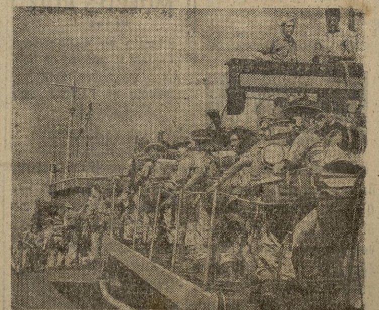
Tropas de infantería aliadas, embarcan para ser transportadas con destino al frente.