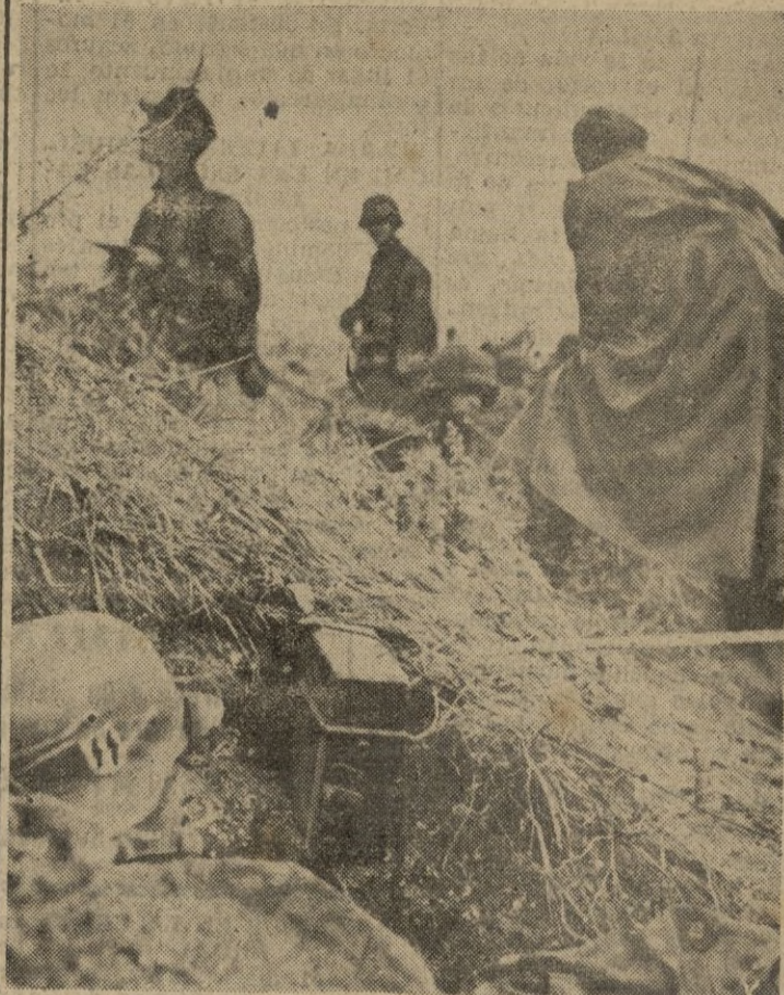
Protegidos por un terraplén, estos soldados alemanes han instalado el observatorio de la artillería, con su teléfono, en la posición más avanzada.