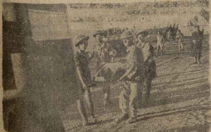
Los heridos aliados en los campos de Italia son trasladados a la retaguardia.