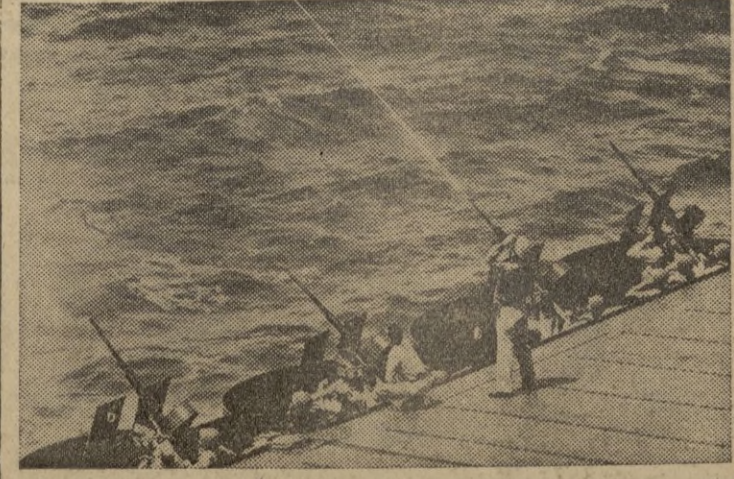
Baterías anti-áreas en acción, en la cubierta de vuelo de un portaaviones