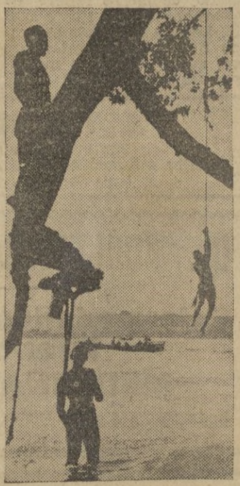
Cuando la lucha lo permite, las maravillosas costas italianas sirven de recreo para los soldados americanos.

del río Volturno, en cuyas orillas se cree que intentarán resistir los alemanes. "Los soldados de Montgomery han avanzado 25 kilómetros con la conquista de Lucera y según las últimas noticias, prosigue el avance."