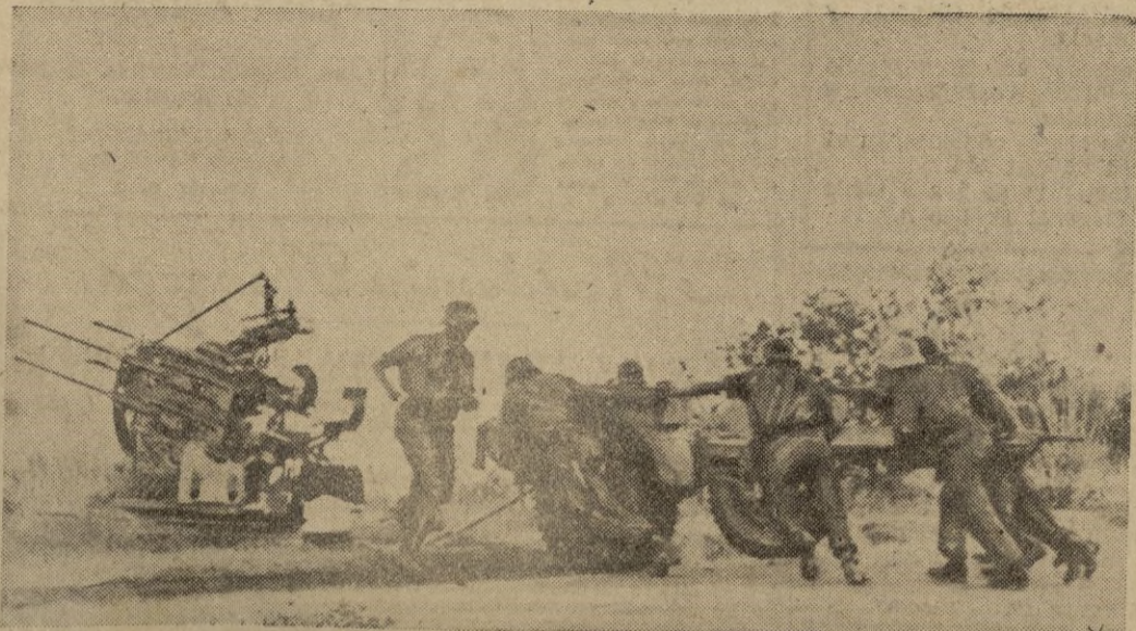
Artillería antiáerea alemana en un puesto avanzado de la Italia meridional.