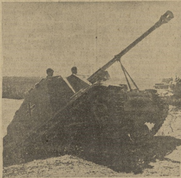
Como un monstruo el tanque avanza, con su pesada mole, hacia los frentes de batalla.