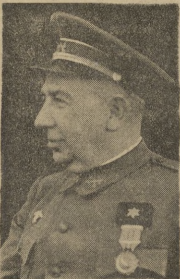
Discurso de S. E. el general Orgaz

Alteza: La Pascua de Aid el Seguer que hoy conmemora y celebra el pueblo musulmán, y que con respeto y solemnidad creciente practica esta Zona feliz de nuestro mandato, nos ofrece en la grata frecuencia con que estas festividades religiosas se suceden una ocasión más