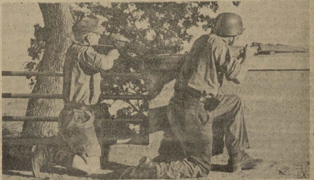
Todos los hombres son necesarios. Hasta el automovilista de un camión alemán interviene en la lucha con su pistola automática.