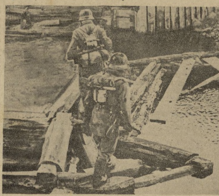
Patrullas alemanas persiguen a los grupos de bandidos aislados que infestan algunas regiones pantanosas del frente central. Unos soldados pasando el río, por un puente improvisado.