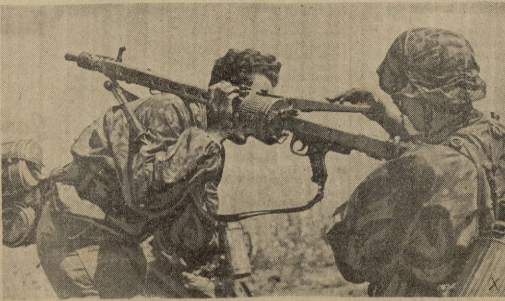
Los aviones soviéticos intentan aproximarse a las posiciones alemanas. Este tirador dispone de su ametralladora sobre el hombro de un camarada, para repeler el ataque.

Loza, Cristal, Vajillas, Objetos de Regalos. Precios económicos. Falange Española, 41 primer piso.