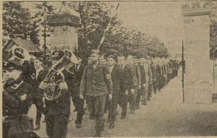
Numerosos voluntarios holandeses se han enrolado en la Marina de guerra alemana, en el pasado septiembre. Con una banda de música a la cabeza, entran en el cuartel

"Sol" dando los gritos el jefe provincial.