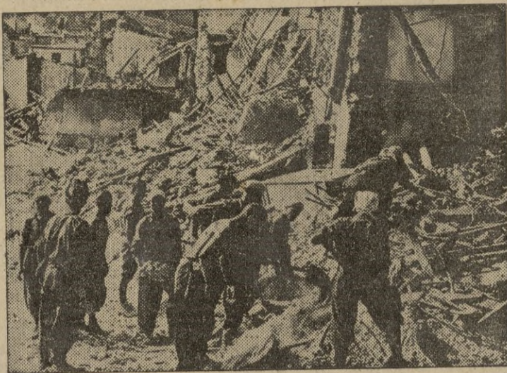
En las ciudades italianas, grupos de obreros se dedican a retirar los escombros de las calles de algunos pueblos en ruinas.