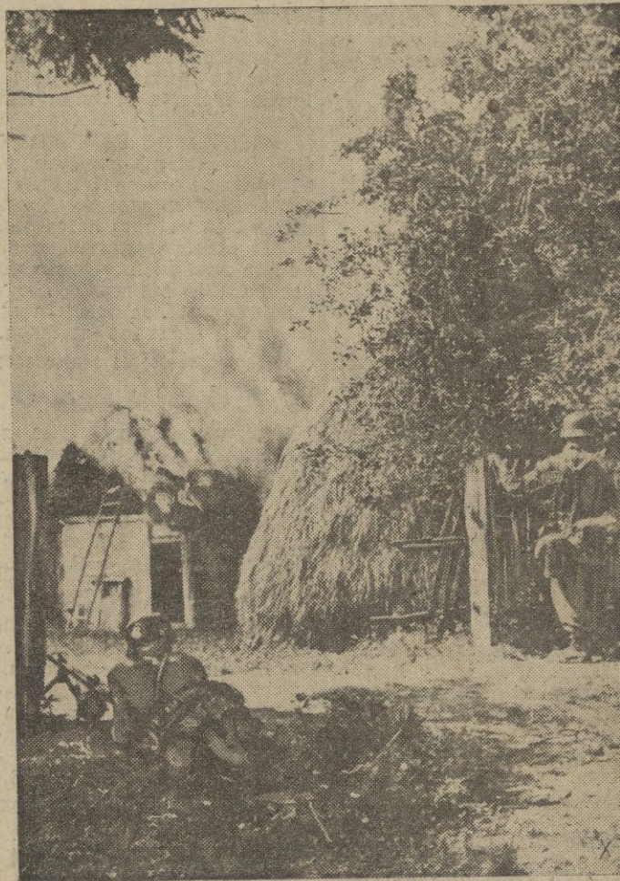
Granada de alemanes toman el asalto una aldea soviética compuesta de miseras chozas y donde los bolcheviques consiguen tenaz resistencia.