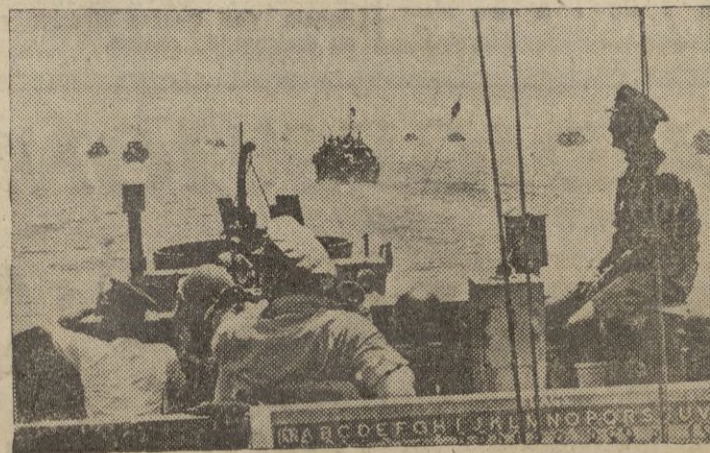
Los barcos de las naciones unidas se extienden a lo lejos aproximándose a las costas italianas para la invasión.