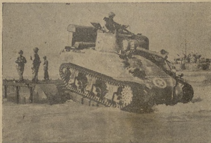
Un tanque americano saliendo de una unidad de desembarco para dirigirse a las costas italianas