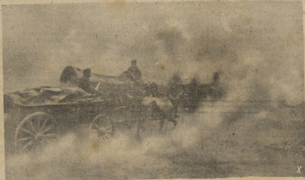
En el arco del Ori, bajo un sol agotador, soldados y caballos marchan a las primeras líneas envueltos por la arena caliente de la estepa. Son los vehículos, con municiones y víveres para los que combaten